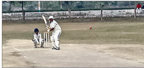
रोहताक। मैच के दौरान बल्लेबाजी करता खिलाड़ी।