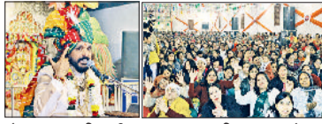
रोहताक। नानी बाई का मायरा नरसी का भात में सम्पन्न हुआ। आयोजन को प्रवचन सुनते भक्तजन।

रोहताक। श्री श्याम परिवार द्वारा आयोजित कथा नानी बाई का मायरा नरसी का भात का प्रथम दिन बड़े आनंद, भक्ति भाव और उत्साह के साथ सम्पन्न हुआ। आयोजन को प्रवचन सुनते भक्तजन। लेकर श्रद्धालुओं में बड़ी उत्सुकता और उत्साह देखने को मिला। दिन में 2 बजे से ही महिलाओं, युवाओं और बुजुर्गों सहित बड़ी संख्या में श्रद्धालुओं की अपार भीड़ का ताता लगाना शुरू हो गया। आयोजन के दौरान स्वयंसेवकों द्वारा सुरक्षा, स्वच्छता और बैठने जैसी व्यवस्थाओं का विशेष ध्यान रखा गया, जिससे कार्यक्रम शांतिपूर्ण ढंग से सम्पन्न हुआ। श्रद्धालुओं ने बताया कि इस दिव्य आयोजन से उन्हें आध्यात्मिक शांति, सकारात्मक ऊर्जा और आत्मिक शांति की अनुभूति हुई। कार्यक्रम समाप्त पर श्री श्याम परिवार ने आप हुए सभी श्रद्धालुओं का आभार व्यक्त किया।